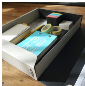
▲ 小物のこぼれ落ちを防ぐスライド式のストッパー付き