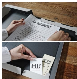
▲ 書類を挟めるバインダーや名刺用ポケットはそのまま