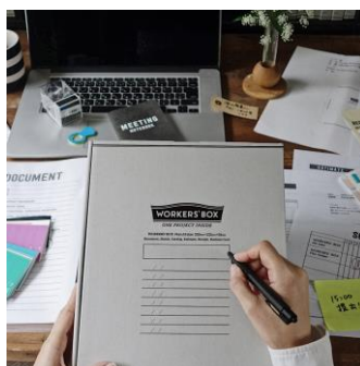
▲ 表紙にタイトルを書き込んで関連書類や小物を一括整理

一般販売は2020年2月を予定。現在、オンラインでは期間限定の「超早割」「早割」を含む先行予約の受付を開始しています。詳しくは「WORKERS' BOX」の公式サイトをご覧ください。（ https://www.workers-box.com/a4-wide/ ）