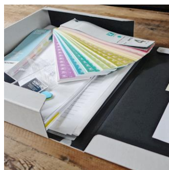
▲ 商品サンプルや色見本なども収納できる内寸56mmの厚さ