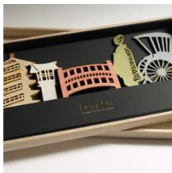
▲桐箱入りの古都シリーズ