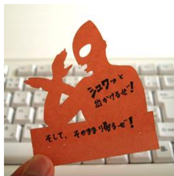
▲10月発売予定のウルトラマン版