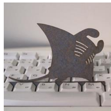
▲美ら海水族館限定版