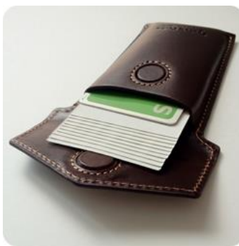
▲名刺やICカードを約15枚収納