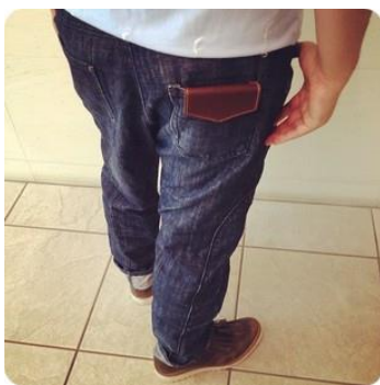
▲革靴とコーディネート