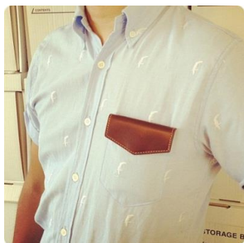
▲スーツやシャツの胸ポケットに

カラーは「ブラック（BK）」「ブラウン（BR）」「ホワイト（WH）」の3種類。今後はカラーバリエーションの追加や女性向けデザインの展開も予定しています。ハイモジモジの直販サイト「SHOP MOJIMOJI」（ http://www.hi-mojimoji.com/shop/ ）で先行販売を行うほか、全国の百貨店、雑貨店等でお買い求めいただけます。